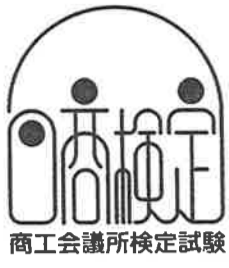
日商簿記検定試験

私はこの本から「会社の真の 姿」がわからなければ、経営 は怖くてできない、ということ を学びました。人間で言えば、 朝起きた時の「気分」だけでは なく、体温を測らなければ正確 な健康状態はわかりませんよ ね。大切なことは、実態をいか に正しく表すか、です。会社の